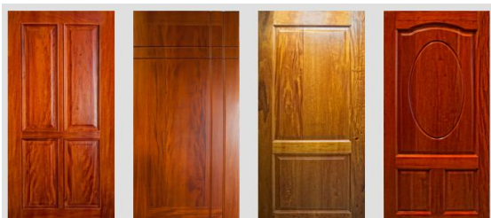
Puertas de producción local en Caoba