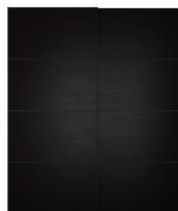
Ejemplos de puertas Internacionales