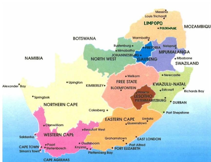
Figura 1 División Administrativa del País

Las dos provincias más pobladas de Sudáfrica son Gauteng (capital, Johannesburgo) y KwaZulu-Natal (Pietermaritzburg), las cuales concentran en su conjunto a 43% de la población. Les siguen Cabo Oriental (Bhisho), Cabo Occidental (Ciudad del Cabo) y Limpopo (Polokwane), las que a su vez concentran a 35% de la población. Medidas por su participación en el gasto en consumo, las provincias de Gauteng, KwaZulu-Natal y Cabo Occidental reúnen 71% del gasto nacional, aumentando esta participación a 83% si sumamos las provincias de Cabo Oriental y Limpopo.