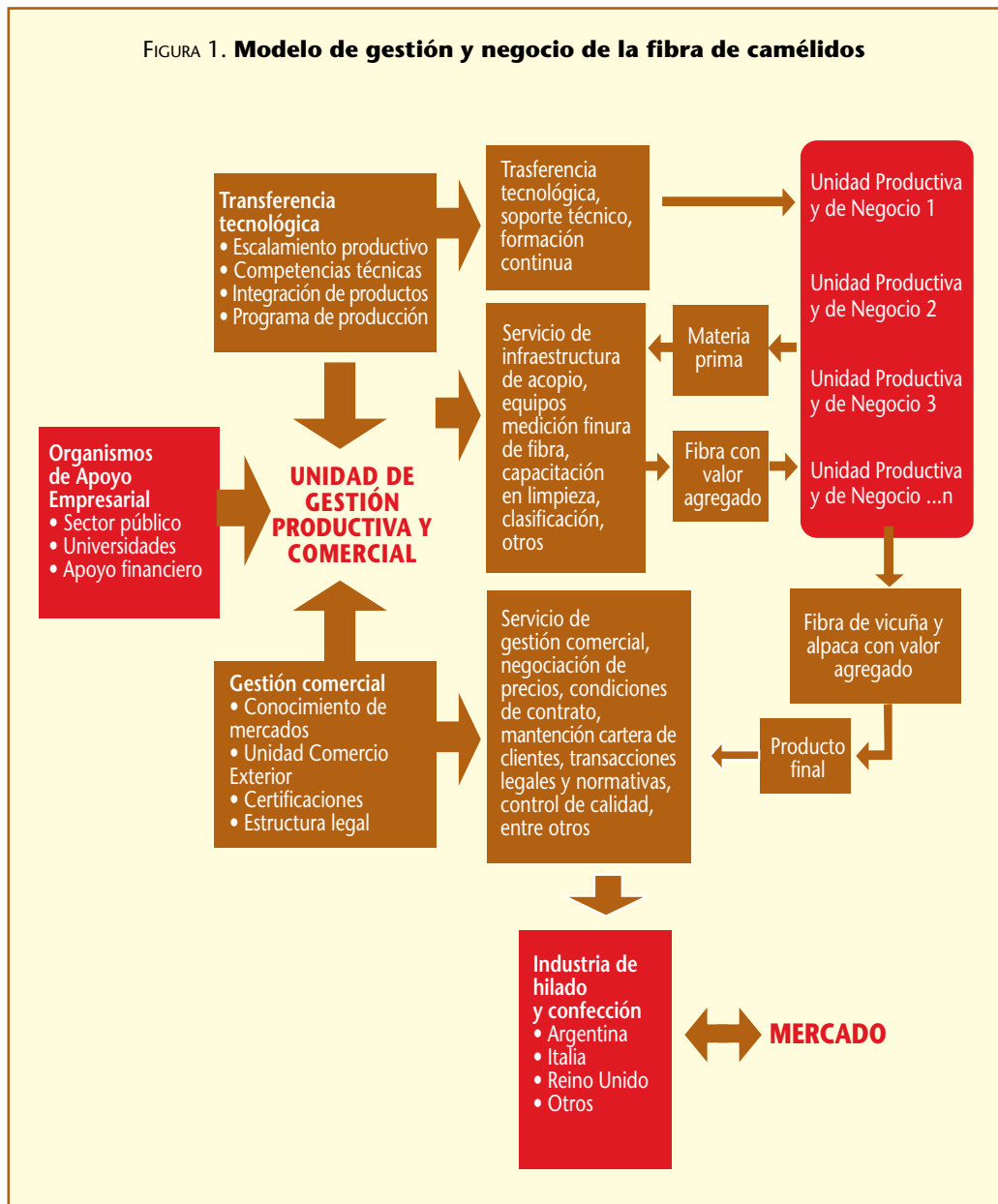
FIGURA 1. Modelo de gestión y negocio de la fibra de camélidos

La implementación del modelo requiere de un ámbito de gestión que imprima un sentido estratégico a las acciones productivas y de comercialización del sistema, y que preste apoyo a las unidades productivas y de negocios. El modelo asigna este rol a una plataforma de gestión central denominada “Unidad de Gestión Productiva y Comercial”; subordinada a las estrategias de ésta, contempla un segundo ámbito radicado en los productores, quienes asumen la generación de productos competitivos y ajustados a las expectativas de los clientes, a través de las “Unidades Productivas y de Negocios”. El desarrollo de estas últimas requiere de su articulación con un tercer ámbito: el de las “Unidades de Apoyo Empresarial”, que convoca los recursos técnicos y financieros para el desarrollo de los escalamientos productivos, asesorías y capacitación de los productores.