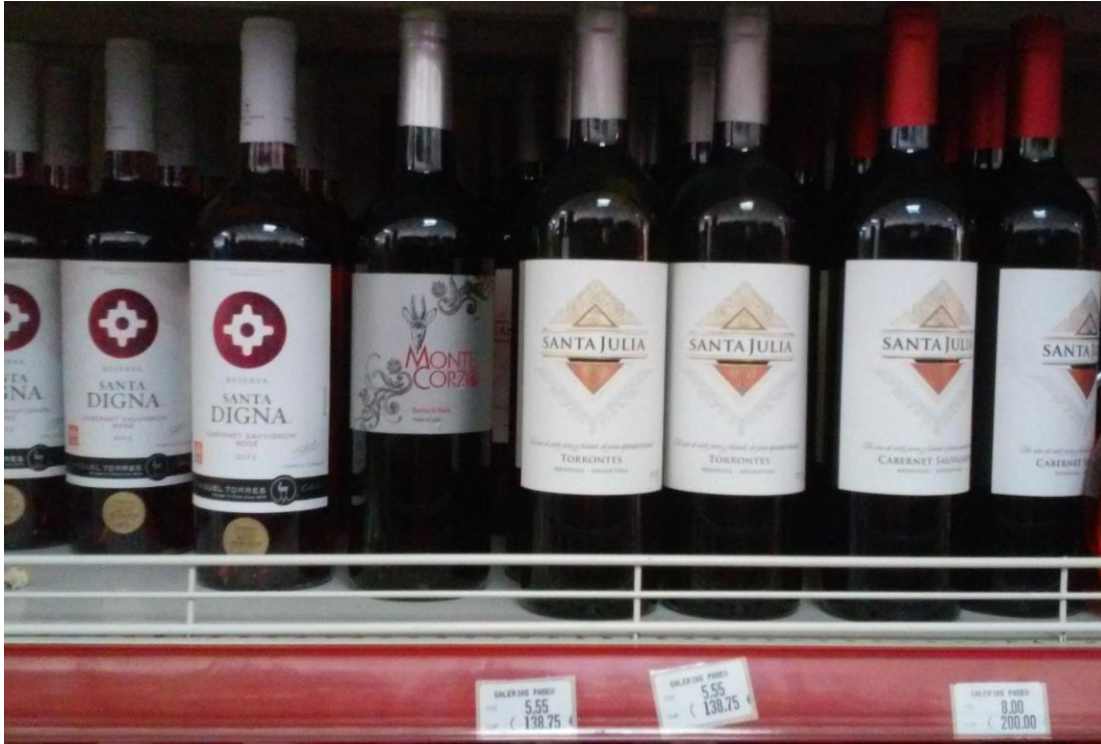
Imagen 3. Productos de viñas de Chile, España y Argentina.