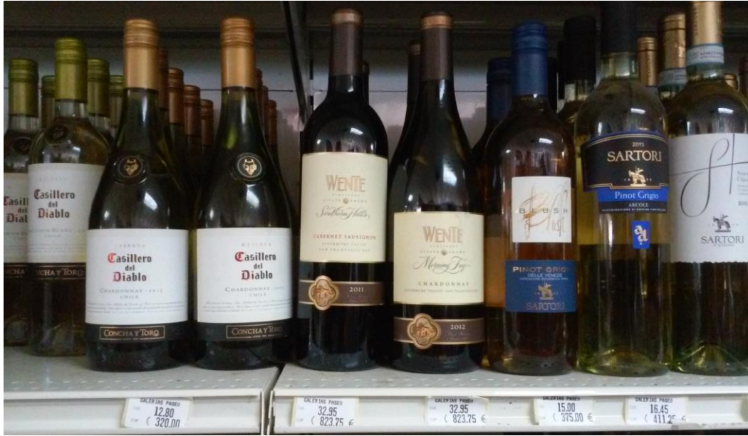
Imagen 1. Productos de viñas de Chile, Estados Unidos, e Italia.