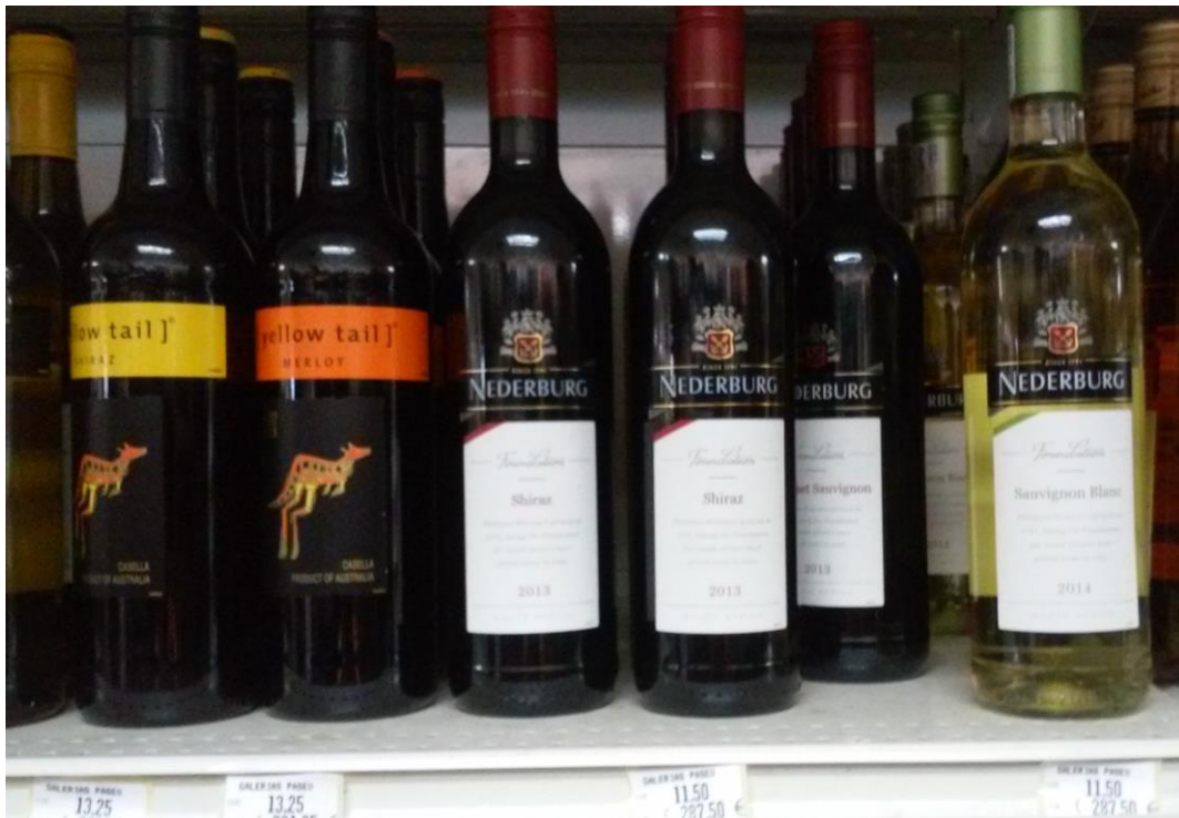
Imagen 2. Productos de viñas de Australia y Sudáfrica.