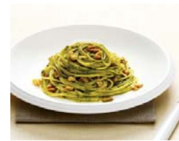
Pasta con Nueces Vecchia & Nuovo

La comisión de California también apoya eventos realizados por las corporaciones coreanas, las cuales distribuyen información sobre los beneficios de las nueces sobre la salud humana, a través del sitio web ( www.walnuts.co.kr ).