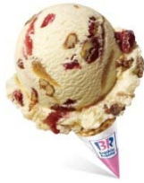
Helado Prince Cranberry Walnut Basking Robbins