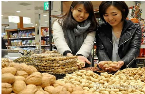
Lotte Department Store en Busan - 5 de Febrero