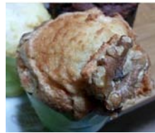
Muffin de nueces Manoffin