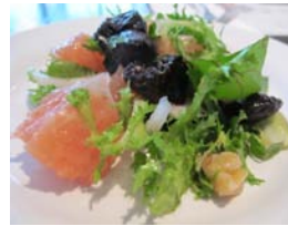
Ensalada de pomelo y nueces Ashley