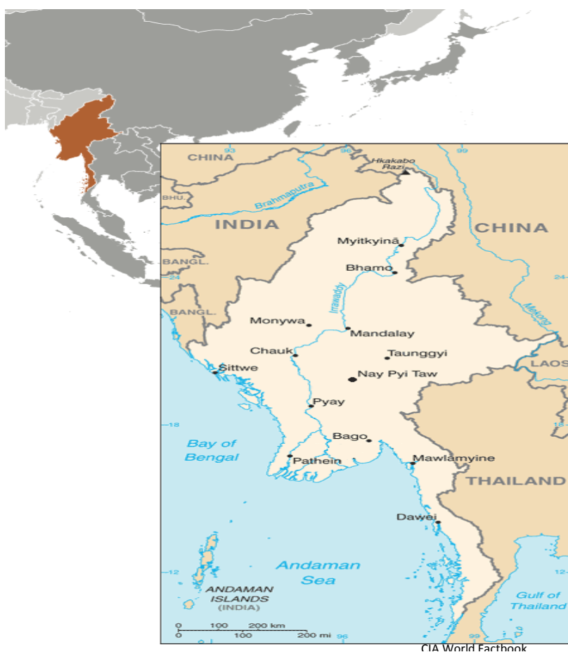
CIA World Factbook