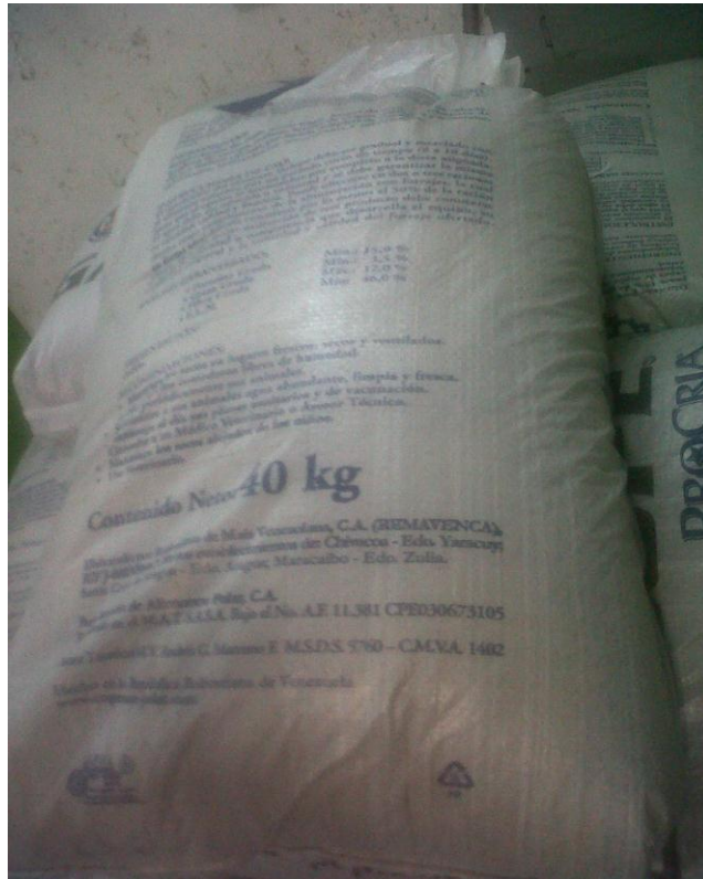
Anverso de un saco de alimentos para animales