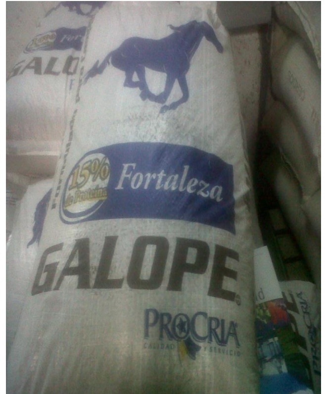
Reverso de un saco de alimentos para caballos

De requerir sacos impresos, las empresas normalmente pagan por el cliché la primera vez que hacen el pedido. Luego el formato es guardado para enviar todos los sacos con la impresión que requiere la industria usuaria.