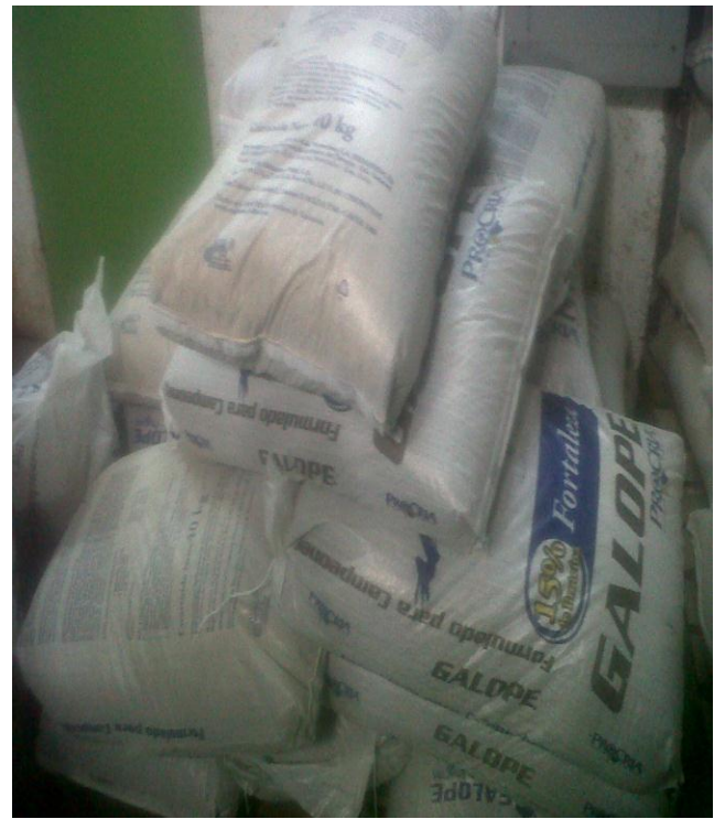
Modelo de saco para empacar alimentos para animales, conocido como “saco azucarero” de hasta 50 kilos de capacidad.