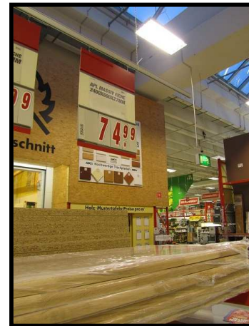
Cubierta de Roble 2400x600x27mm Precio 74,99 euros