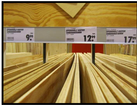
Contrachapado de Pino 1200x600x6mm. Precio 12,99 euros 1200x600x4mm. Precio 9,99 euros 1200x600x10mm. Precio 17,99 euros