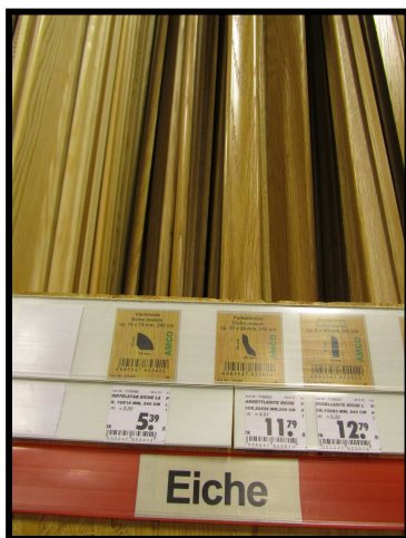
Molduras de Roble 14x14mm, 240 cm 5,39 euros 22x38mm, 240 cm 11,79 euros 10x60mm, 240 cm 12,79 euros