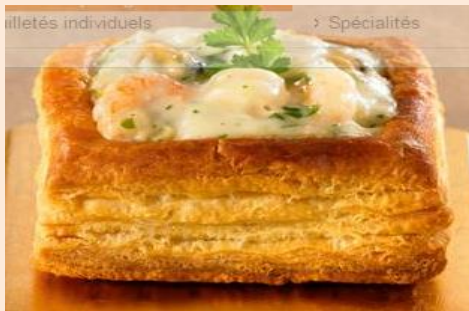
Pastel de mariscos (incluye choritos) – Marca ARGEL