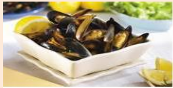
Mejillones rellenos – Marca PICARD