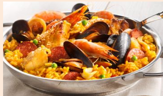
Paella Real – Marca TOUPARGEL