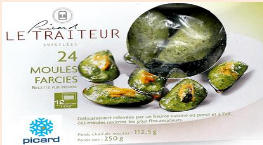
Mejillones preparados (origen Chile) – Marca ARGEL