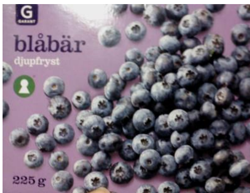
Arándanos congelados 225gr. - precio: aprox. 4,50USD.