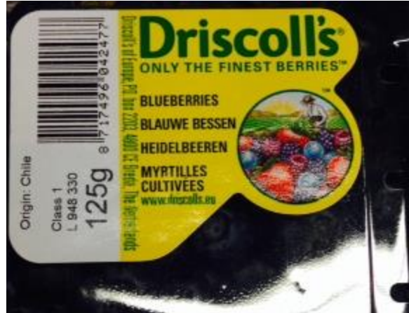
Arándanos frescos. 125 gr, país de origen Chile. Precio: 3 USD.