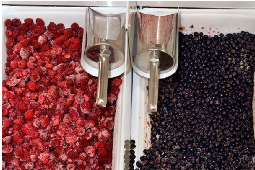
Arándanos y berries congelados, precio por kilo, aprox. 14 USD.