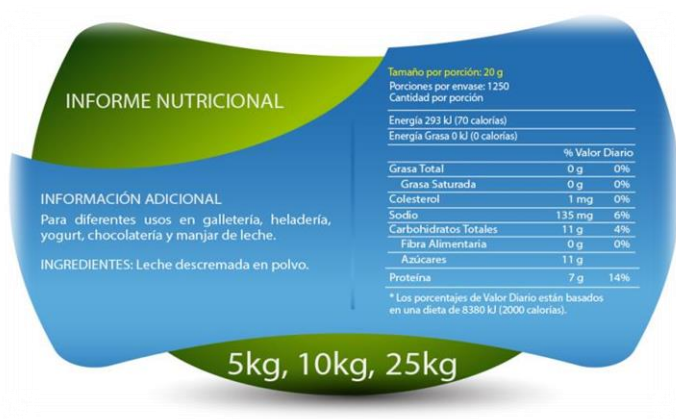
Ejemplo de etiquetado de leche en polvo descremada: "El Ordeño".